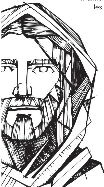
Conception de la maquette : Jérémie Laliberté.

39 Beaucoup de Samaritains de cette ville crurent en Jésus. 40 Lorsqu'ils arrivèrent auprès de lui, ils l'invitèrent à demeurer chez eux. Il y demeura deux jours. 41 Ils furent encore beaucoup plus nombreux à croire à cause de sa parole à lui, 42 et ils disaient à la femme : « Ce n'est plus à cause de ce que tu nous as dit que nous croyons: nous-mêmes, nous l'avons entendu, et nous savons que c'est vraiment lui le Sauveur du monde. »