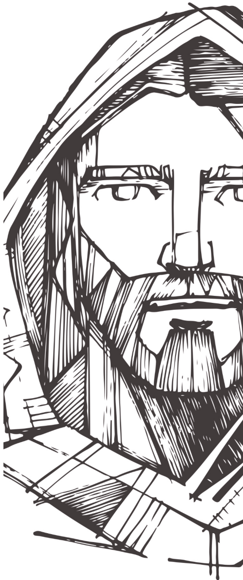
Conception de la maquette : Jérémie Laliberré. Préparation du feuillet biblique : Yves Guérette

48 là où le ver ne meurt pas et où le feu ne s'éteint pas.