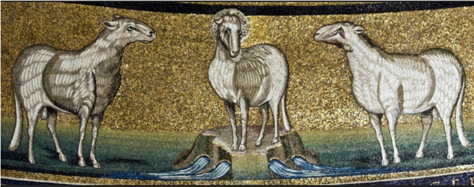
Mosaïques, église Saint-Praxède, Rome

Mais, si tu n'aimes pas ton frère que tu vois, comment peux-tu aimer Dieu que tu ne vois pas (1Jn 4,20)? En aimant les brebis, montre que tu aimes le Pasteur, car justement, les brebis sont les membres du Pasteur. Pour que les brebis soient ses membres, le Pasteur a consenti à devenir la brebis conduite à la boucherie (Is 53,7). Pour que les brebis soient ses membres, il a été dit de lui: