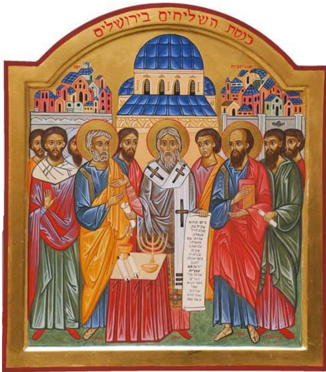
Icône du « Concile » de Jérusalem

fil d'homme pour que vous puissiez être fils de Dieu. Aussi, bien que je sois le même dans l'un et l'autre de ces états, du fait que je me rends semblable à vous, je suis inférieur au Père. Mais du fait que je ne me sépare pas de lui, je suis encore supérieur à moi-même.